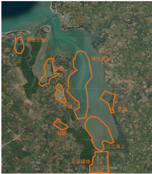
图1 海南东寨港国家级自然保护区及其周边的调查样区分布

是红树林、潮间带滩涂和浅水海域;三江湿地的生境由红树林(50%)、养殖塘(30%)和水稻田(20%)组成。